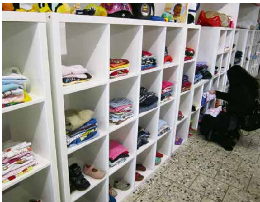
Ab Babygröße 50 – sorgfältig sortiert ist die Kleinkindabteilung.