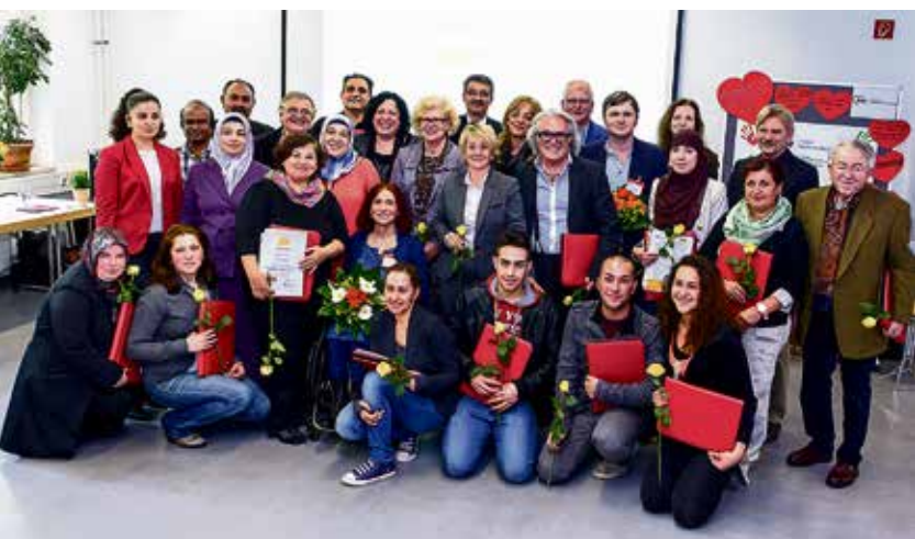
„Vielfalt ist unsere Stärke“: Ehrenamtliche der AWO bei der feierlichen Überreichung der Ehrenamtskarten.

der AWO ausgebildet wurden, um ihren Landsleuten die Integration in den Alltag in Deutschland zu erleichtern. Aufgebaut wurden auch Orientierungscafés im Gelsenkirchener Süden (türkisch, polnisch und jetzt auch bulgarisch und rumänisch) für Zuwanderer, die ganz neu in der Stadt sind.